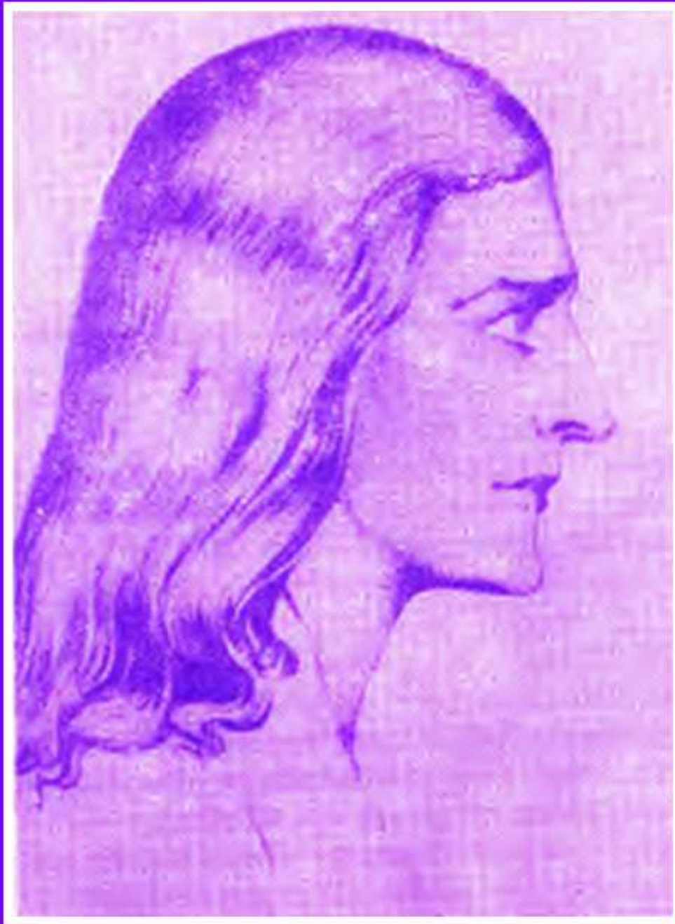
SANTO AEOLUS ESPÍRITU SANTO CÓSMICO