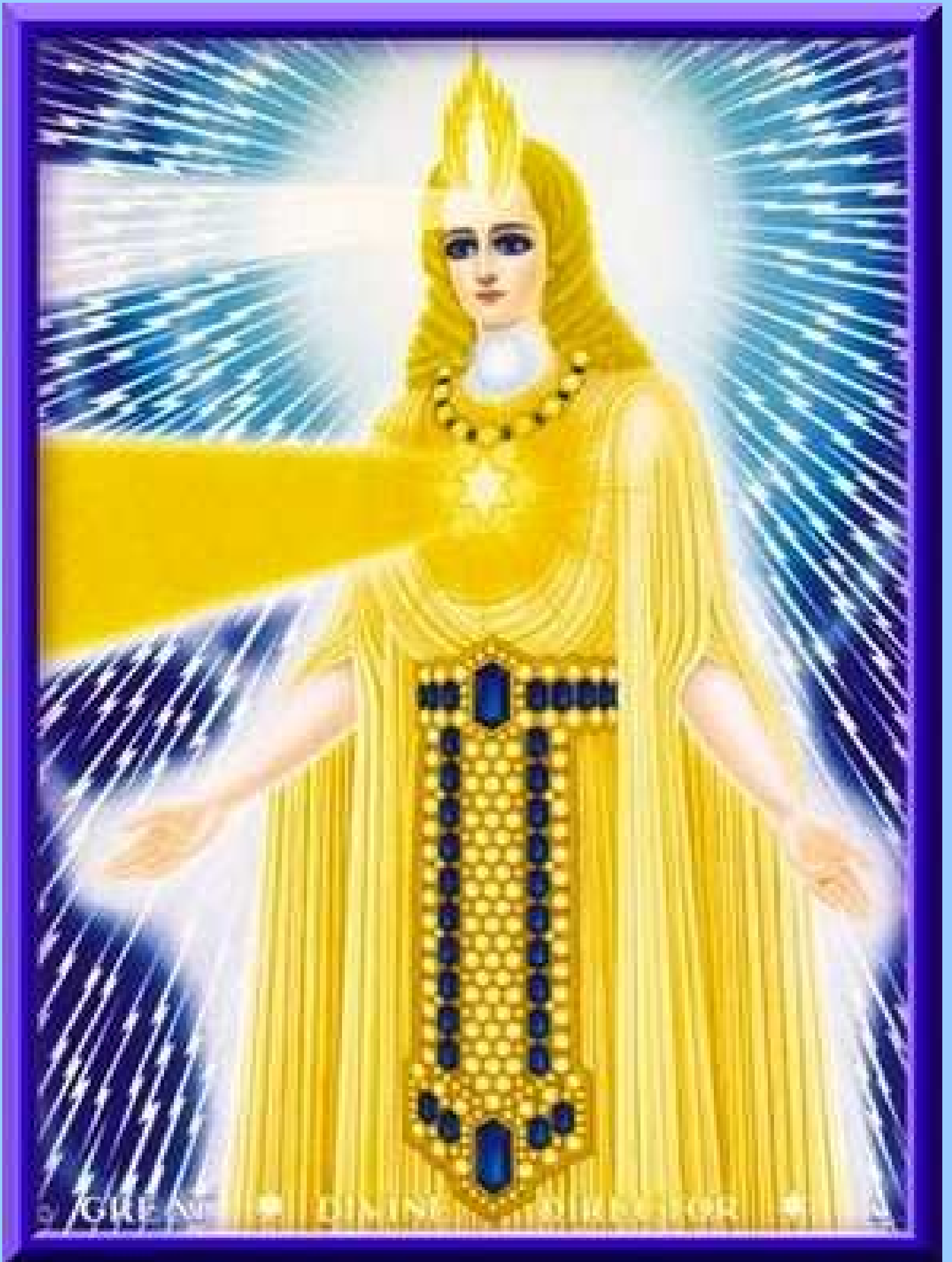
Gran Director Divino