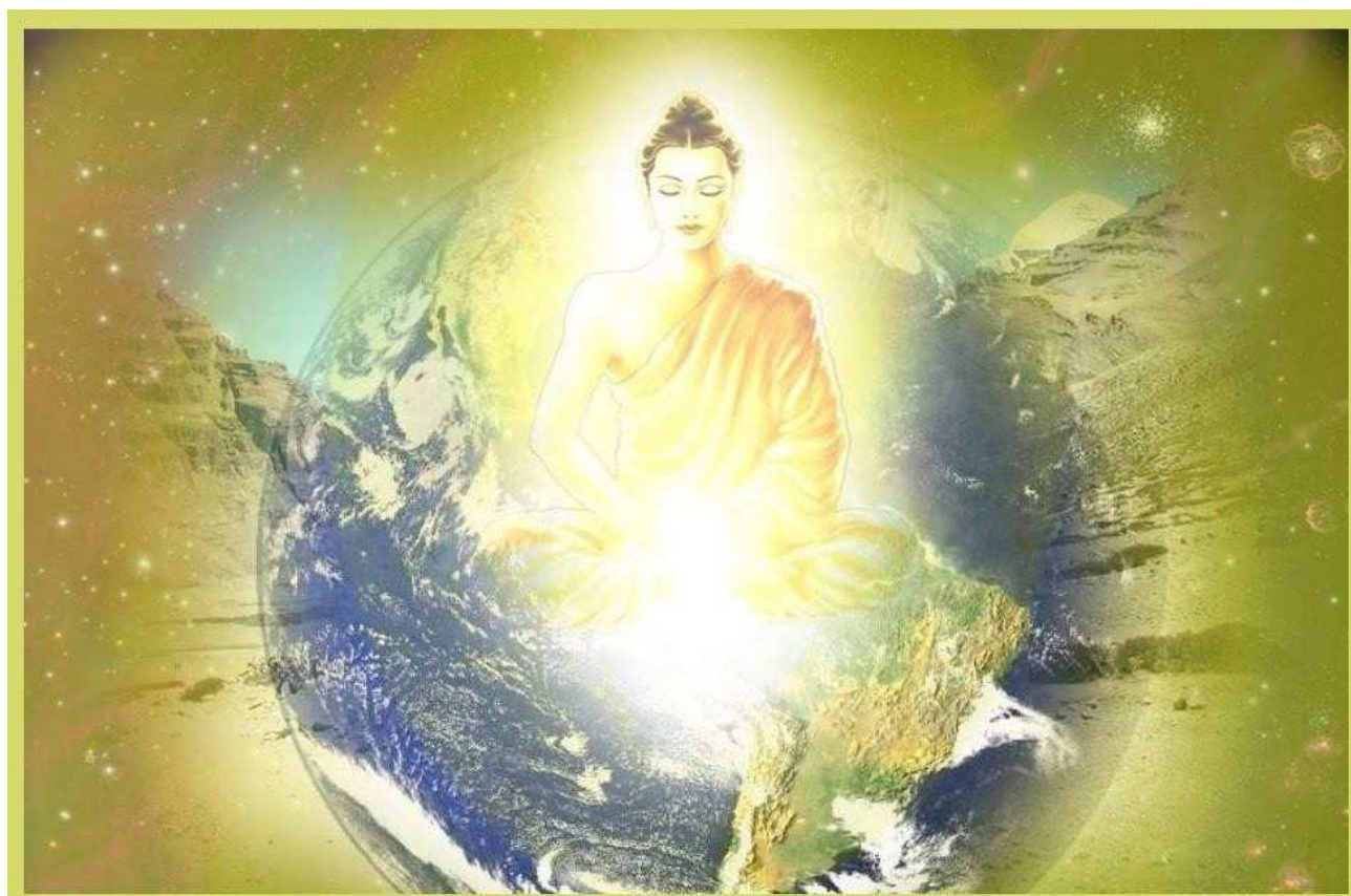
GAUTAMA BUDDHA Actual Señor del Mundo y Jerarca del Retiro de Shamballa