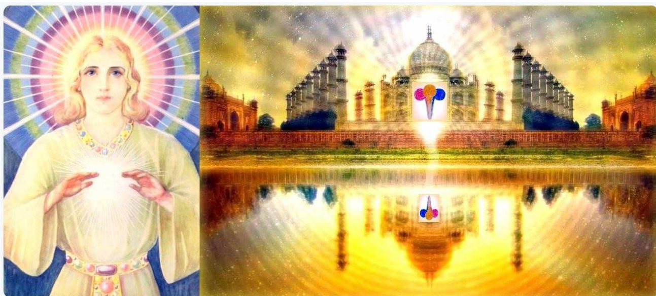
SANAT KUMARA Anterior Jerarca del Retiro de Shamballa