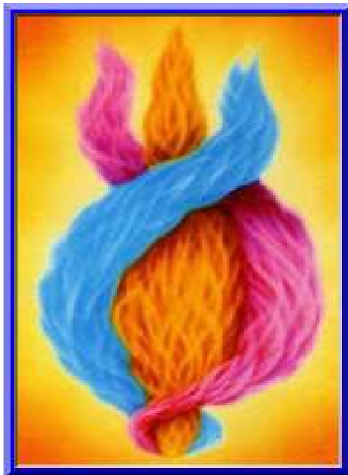
Triple Llama Amor-Sabiduría-Poder Se ubica en el corazón humano

¡Piensen! ¡DIOS está VIVO dentro de mi corazón, o no podría palpar! Sientan su corazón como un destellante Sol Dorado de Luz, expandiéndose hasta que llene cada parte de su cuerpo; vean esa Luz ir a su mente, y a sus sentimientos, véanla llenar la sala o habitación, con SU AMOR y buena voluntad; dejen que se expanda hasta abarcar su localidad, y después el mundo. Entonces denle su atención a la Imagen de la Santísima Trinidad que representa su relación con Dios.