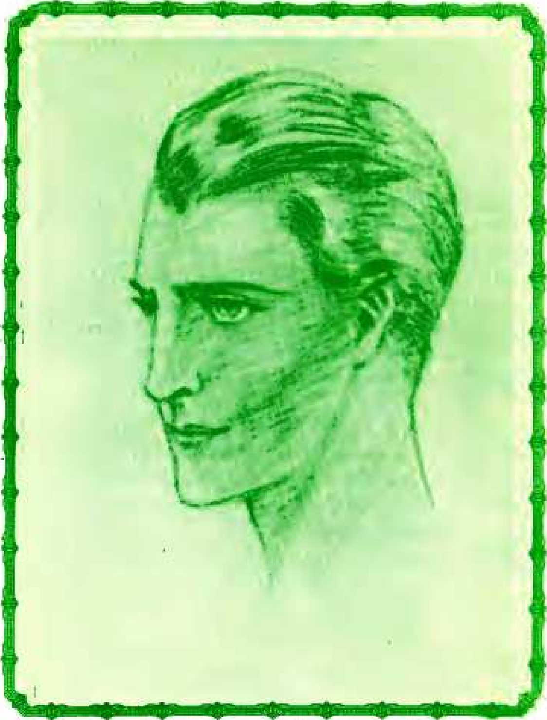
AMADO MAESTRO ASCENDIDO HILARION