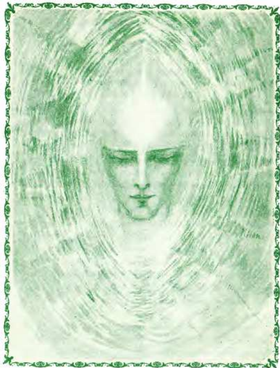
MAESTRO HILARION MOSTRÁNDOSE EN FORMA DE DEVA